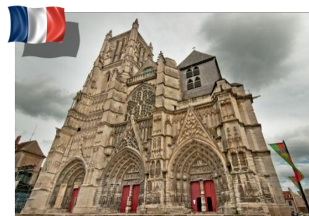
Diocèse de Meaux