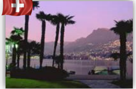
Lugano – Suisse