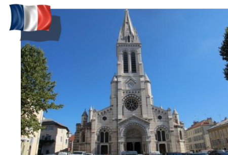
Diocèse de Gap