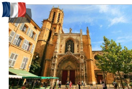
Diocèse d'Aix et Arles