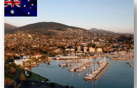
Hobart - Australie