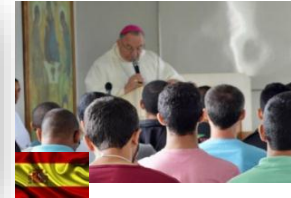
Mgr. Jaume Pujol Archevêque de Tarragona