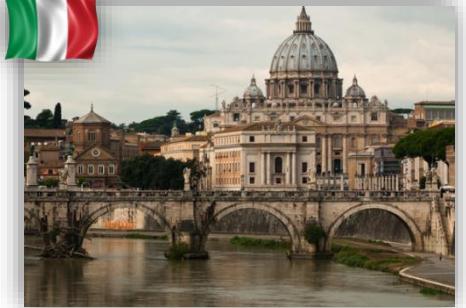
Rome – Italie 3 maisons