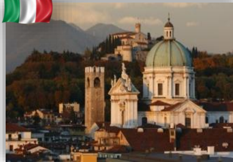
Brescia - Italie