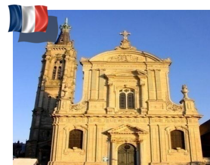
Diocèse de Cambrai