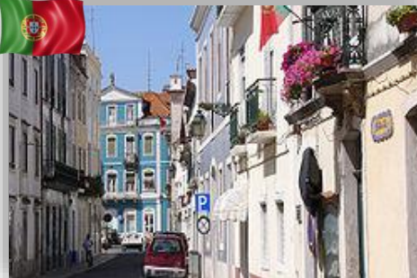
Santarém - Portugal