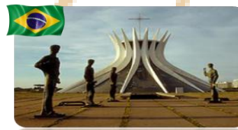
Brasília - DF