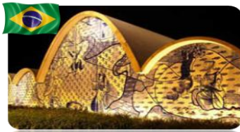
Belo Horizonte – MG