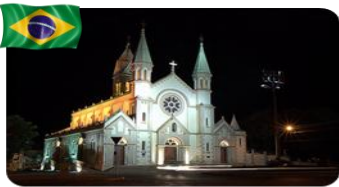
Curvelo – MG