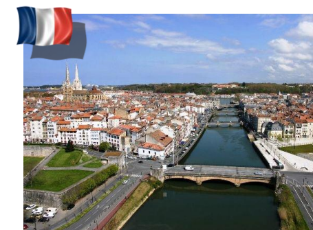
Diocèse de Bayonne, Lescar et Oloron