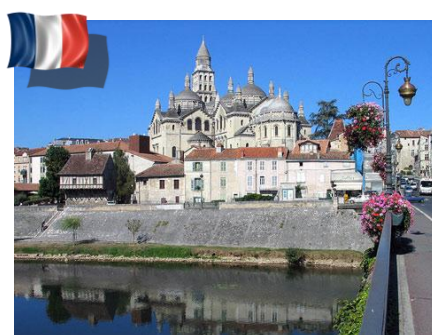
Diocèse de Périgueux