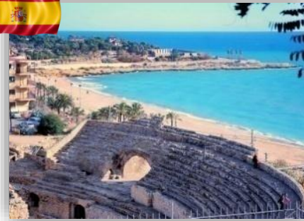
Tarragone - Espagne