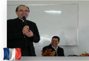
Mgr. Philippe Barbarin Archevêque de Lyon