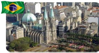
São Paulo - SP