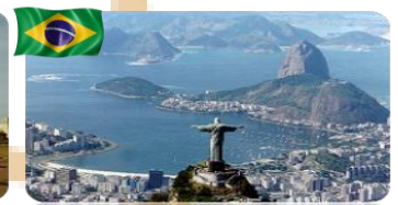
Rio de Janeiro - RJ