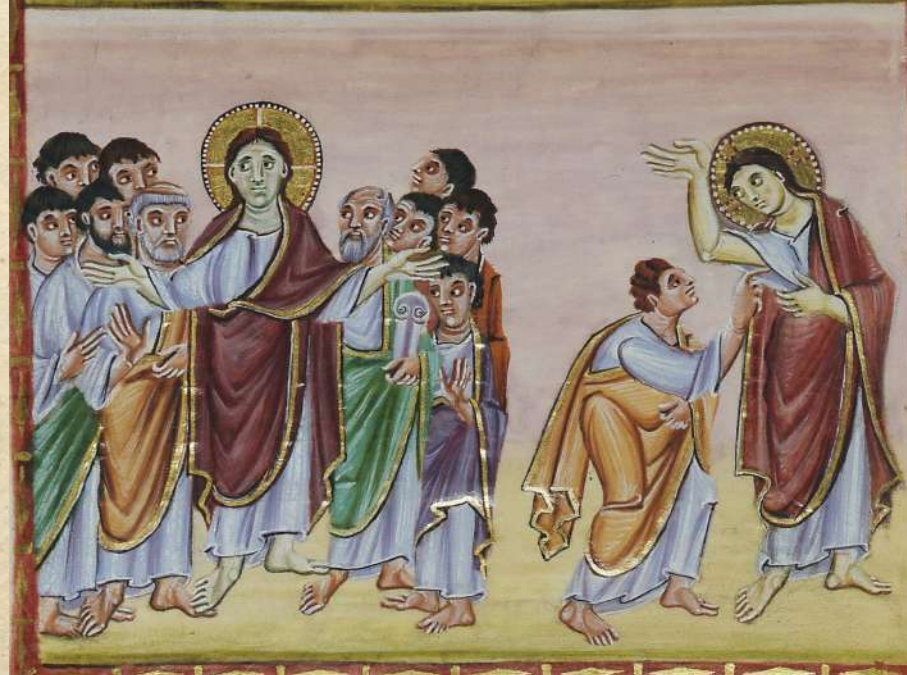
Apparition aux Apôtres