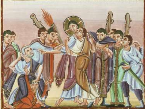
La trahison de Judas

Jésus leur dit: « Mon âme est triste à mourir. Restez ici et veillez. »