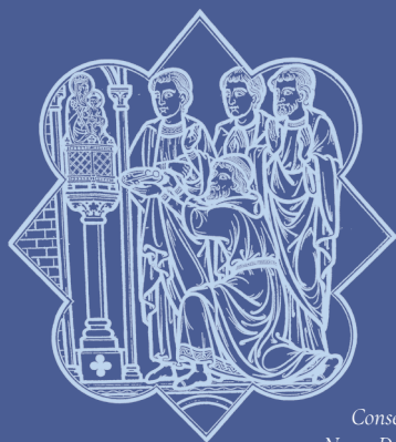
Consécration de Lille à Notre-Dame de la Treille (vitrail de Didron)

Lors de la Grande Procession jubilaire de 1854, la première pierre de la cathédrale de Lille est posée. C'est dans ce sanctuaire, église de tout l'archidiocèse de Lille, que les pèlerins et les visiteurs se rendent pour prier et découvrir la très riche histoire religieuse de la cité et de ses habitants.