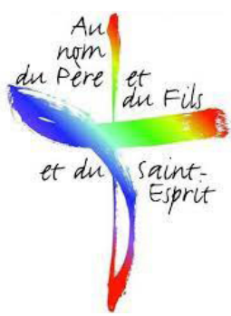
Le signe de croix - SERAPHIM (seraphim-marc-elle.fr)

Pour entrer dans le silence et dans la prière, traçons un beau signe de croix en chantant ensemble : Je vais tracer sur moi, un beau signe de croix. C'est la plus courte des prières. Elle m'habille de lumière.