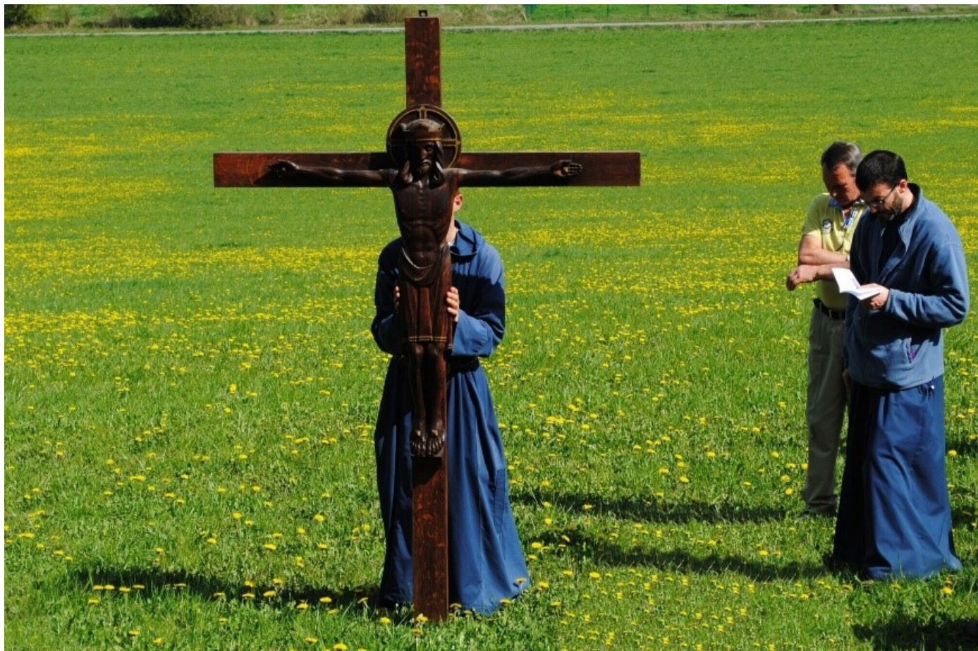
Croix de la fraternité de Tibériade (Lavaux-Ste-Anne - Belgique)