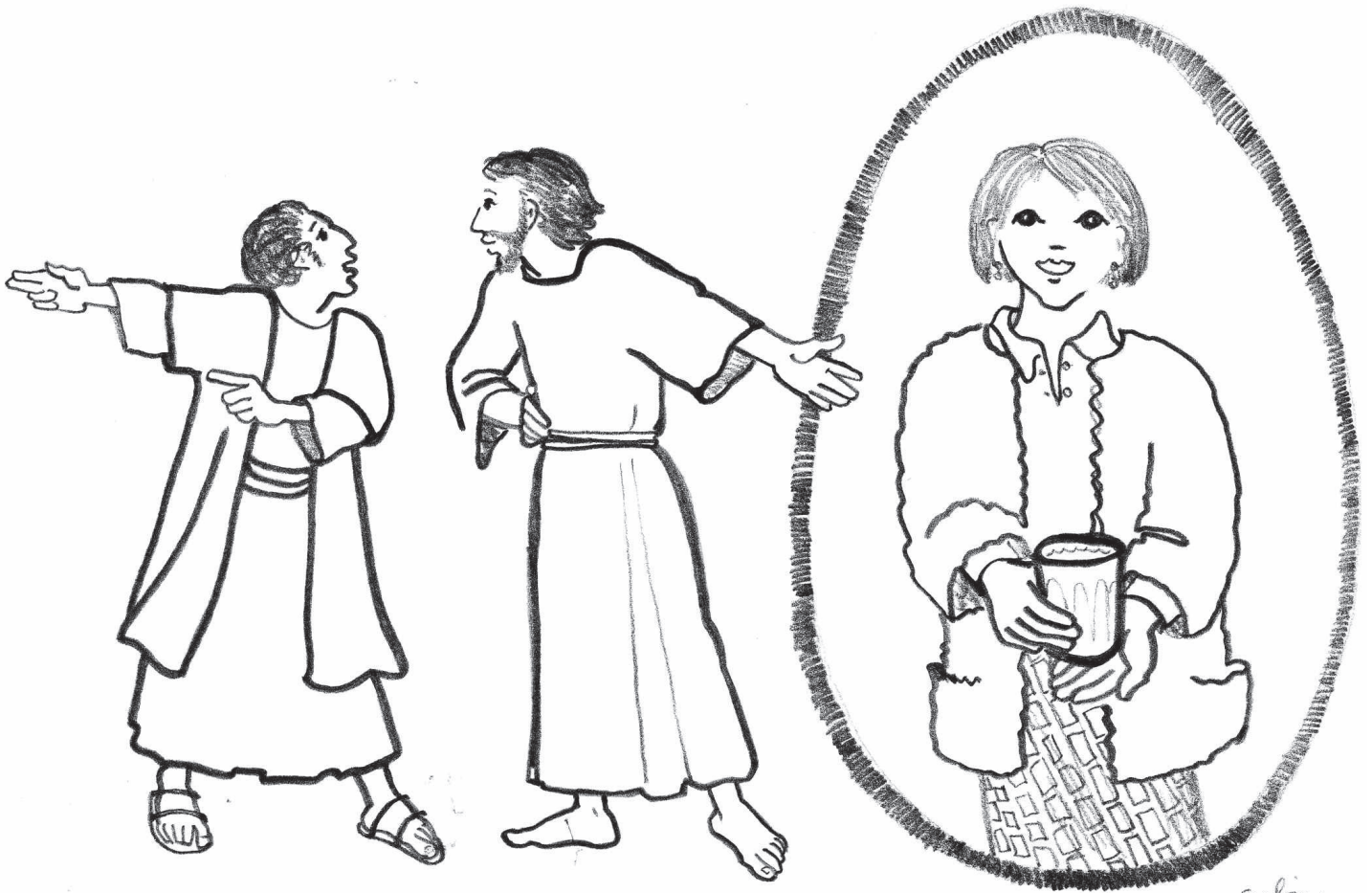
Dessin de Sabine de Coune