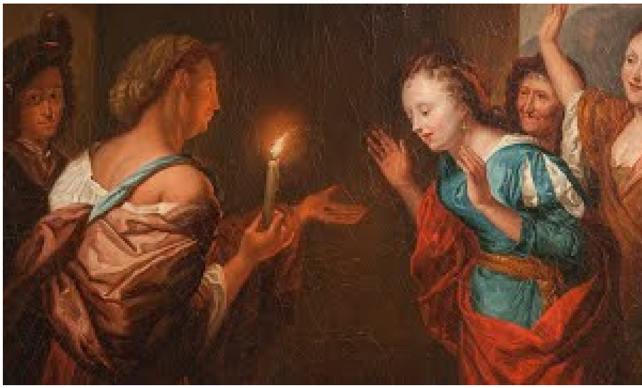
La drachme retrouvée Godfried Schalcken, 1675-80, Collection privée

Regardez bien l'image. Que voyez-vous ? Y a-t-il des ressemblances avec le récit d'Évangile que nous avons entendu ? Lesquelles ? Regardez la main de la femme, que montre-t-elle ? Pourquoi selon vous ? Qu'est-ce que cela suscite ? En tout cas : il y a de la joie ! Oui, il y a de la joie quand on retrouve un objet ou un animal perdu. Mais n'y en a-t-il pas encore bien plus quand on retrouve quelqu'un que nous avons perdu de vue ! ? Une personne que l'on aime qui vivait loin et qui est revenue par exemple.