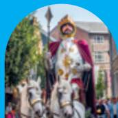
FIERTÉ ET TRADITION