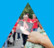
ÊTRE VRAIMENT PROCHES