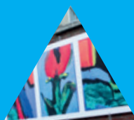
ARTS ET ÉMERVEILLEMENT