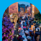
CÉLÉBRATION ET CONVIVIALITÉ