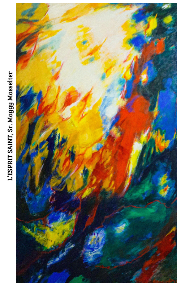
L'ESPRIT SAINT, Sr. Maggy Masselter

De nouveaux ministères au service des Églises locales ?